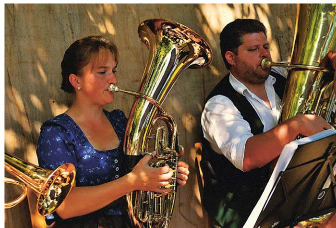
Franui Musicbanda und Tölzer Stadtkapelle