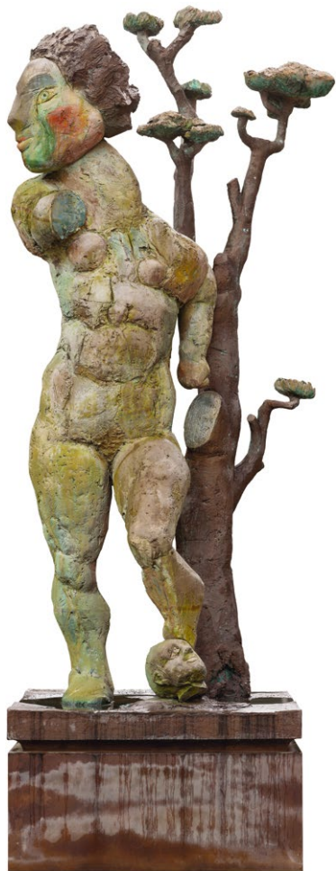
Markus Lüpertz, Daphne, 2003, Bronze