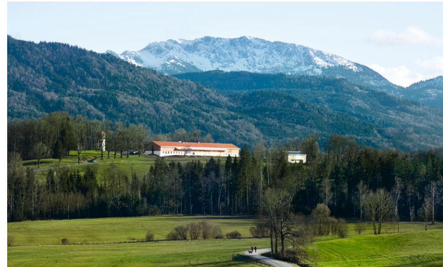
Kultur, Bildung und Landwirtschaft unter einem Dach im neu eröffneten Langen Haus

Mit den Jahren entsteht in Nantesbuch ein Ort, an dem sich Natur und Kunst, Veranstaltungen, Bildungsangebote und kreatives Tun unmittelbar miteinander verbinden.