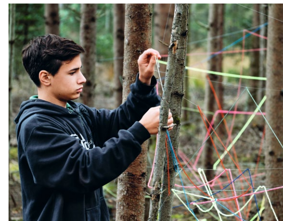
Kreative Auseinandersetzung mit und in der Natur

Einen Schwerpunkt des Engagements im Bereich der Bildungsarbeit stellen Weiterbildungsformate für Lehrer, Erzieher, Kunstvermittler und Multiplikatoren Kultureller Bildung dar.